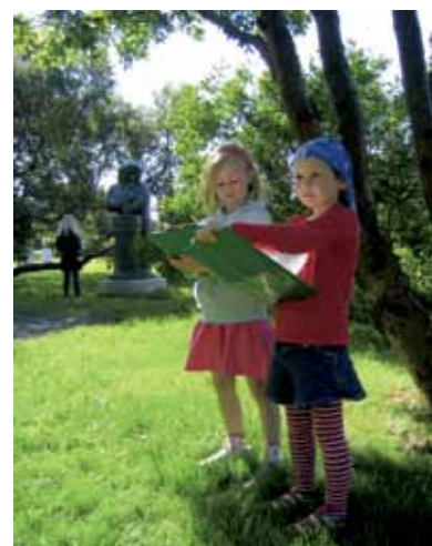
Nemendur skissa í garðinum við Ásmundarsafni.