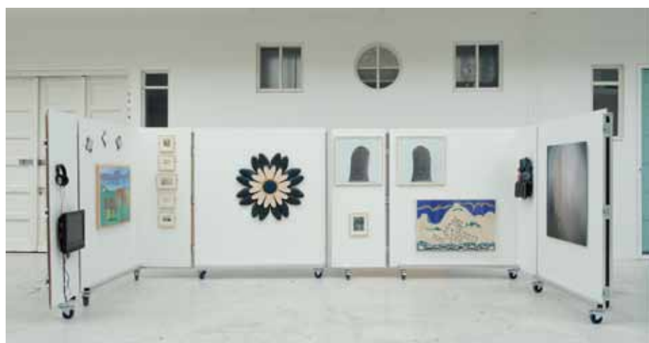
Flökkusýning 2. Náttúrusýnir listamanna /Sitt sýnist hverjum...