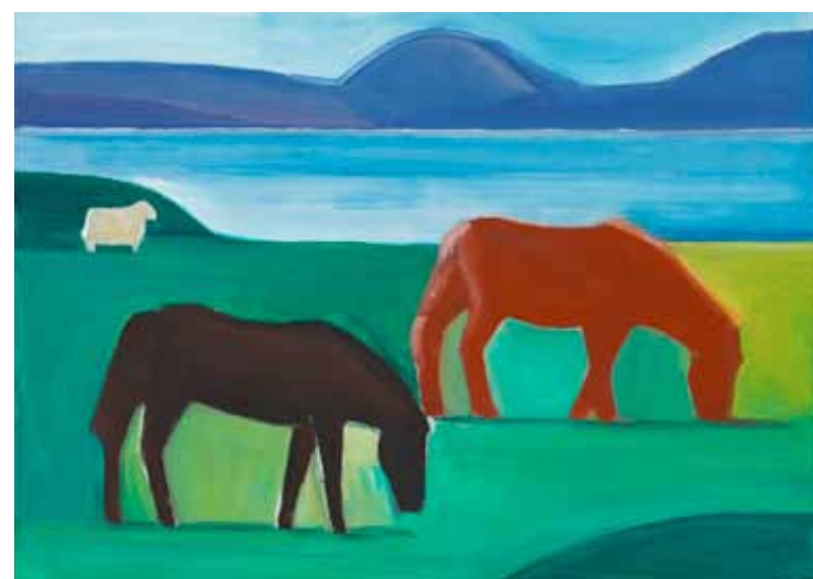
Verk í Flökkusýningu 2 eftir Louisu Matthíasdóttur. Þingvallavatn, 1989.