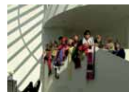
Treflagjörningur í Ásmundarsafni