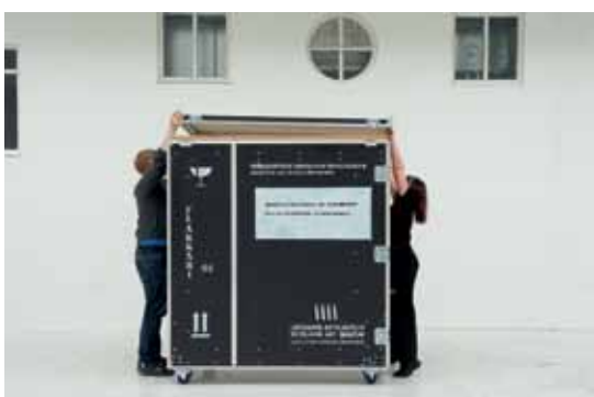
Flökkukista opnuð. Hver sýning er í tveimur kistum.