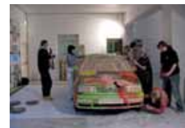
Verkefnið Bíll í Hafnarhúsi.