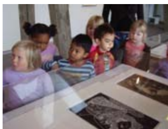
Forvitnileg safnheimsókn á Kjarvalsstöðum.

Tekið er á mót háskólanemum og þeim veitt leiðsögn um sýningar Listasafns Reykjavíkur, í Ásmundarsafni, Hafnarhúsi og á Kjarvalsstöðum. Óski kennarar eftir sérstakri umfjöllun um efni á sérfræðisviði safnsins er þeim bent á að hafa samband við fræðsludeild með góðum fyrirvara. Deildin skipuleggur fyrirlestra og stefnumót við listamenn, sýningarstjóra, menntunarfræðinga og aðra sérfræðinga innan safnsins.