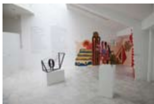
Frá sýningunni RÍM í Ásmundarsafni.

Verkefni um Jóhannes Sveinsson Kjarval veitir góða innsýn í ævistarf listamannsins. Nemendur skoða lykilverk eftir listamanninn og vinna verkefni sem krefst þess að nemendur velji sér verk og rýni í þau, myndi sér skoðun og beri saman áhrifaþætti í listaverkum Kjarvals.