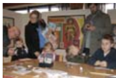
Listsmiðja í tengslum við Flökkusýningu.