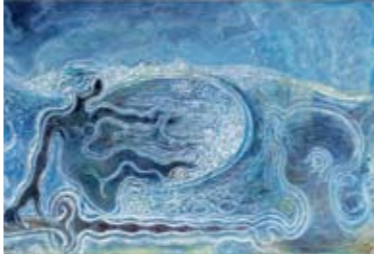
Jóhannes S. Kjarval, 1961. Skjalðmey.

Námskeið fyrir framhaldsskólanema í fjölnotasal Dagana 12., 19. og 26. nóvember og 3. desember verður í gangi fyrir framhaldsskólanema námskeiðið krÚtt og kvikYndi – sjálfsmyndapælingar og pot, ímyndir og myndlist. Námskeiðið tengist einkum sýningum Yoshitomos Naras og Egils Sæbjörnssonar og sýra því sérfræðingar í myndlist, tónlist og myndasögum. Unnið verður bæði þrívítt og tvívítt og afrakstur námskeiðsins hengdur upp í fjölnotasal eina kvöldstund. Aðeins 20 framhaldsskólanemar komast að og kostnaði er haldið í lágmarki. Skráning fer fram gegnum netfangið fraedsludeild@reykjavik.is.