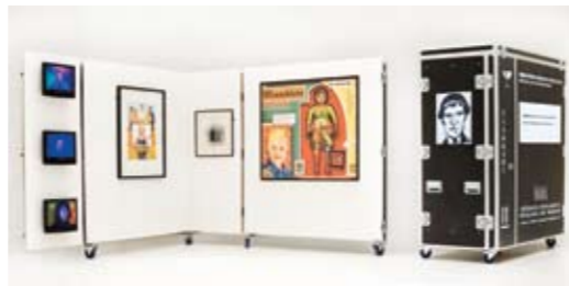
Flökkusýning Listasafns Reykjavíkur.